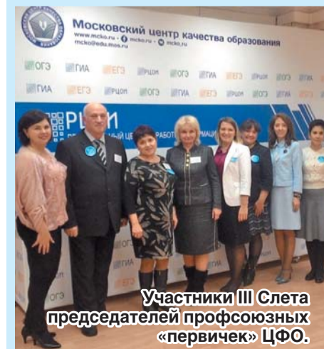
Участники III Слета председателей профсоюзных организаций ЦФО

Программа слета была интересной, насыщенной и очень полезной. За что организаторам – большое спасибо!