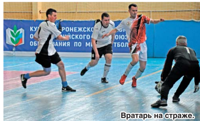
Вратарь на страже.