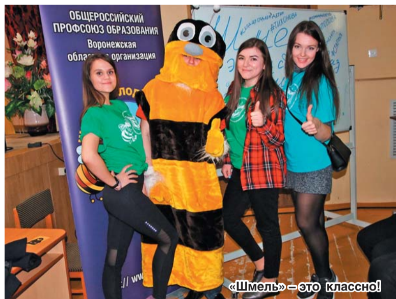
«Шмель» – это классно!