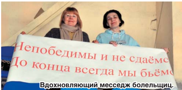
Вдохновляющий месседж болельщиц.