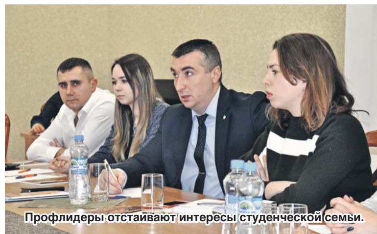
Профлидеры отстаивают интересы студенческой семьи.