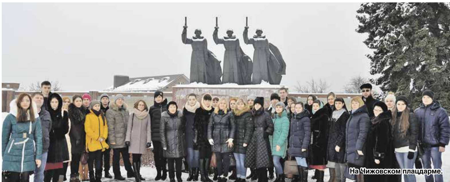
На Чижовском плацдарме.