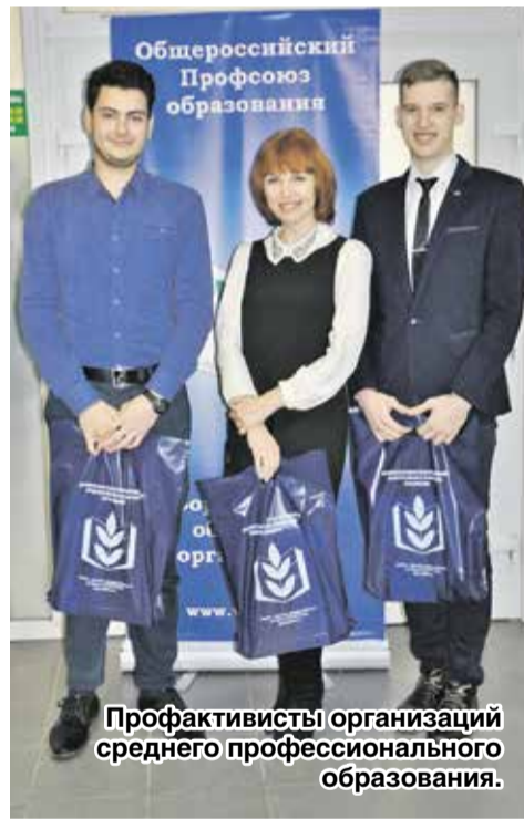
Профактивисты организаций среднего профессионального образования.

Затем последовало награждение студентов почетными грамотами и сувенирами, а также традиционное коллективное фотографирование.