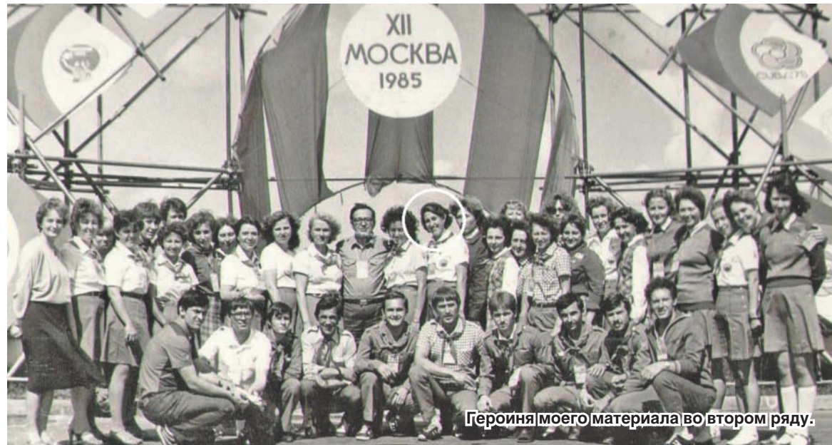
Героиня моего материала во втором ряду.

«В 1983 году работала в Доме пионеров. Узнала, что обком комсомола проводит конкурс по набору в пионерские лагеря «Артек» и «Орленок». Подала заявку на конкурс и приняла в нем участие. А через месяц пришел вызов, и нашу группу из пяти человек от Воронежской области