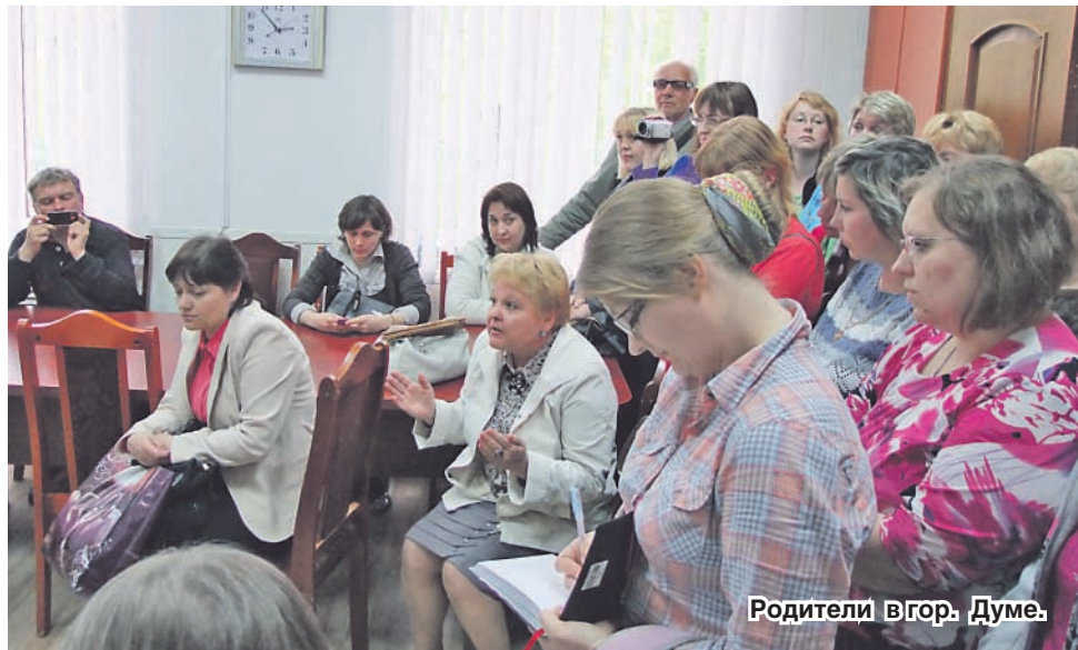
Родители в гор. Думе.

А как же быть с грантом, который выиграла школа № 5 в областном конкурсе «Школа — лидер образования»? В этом году надо от-