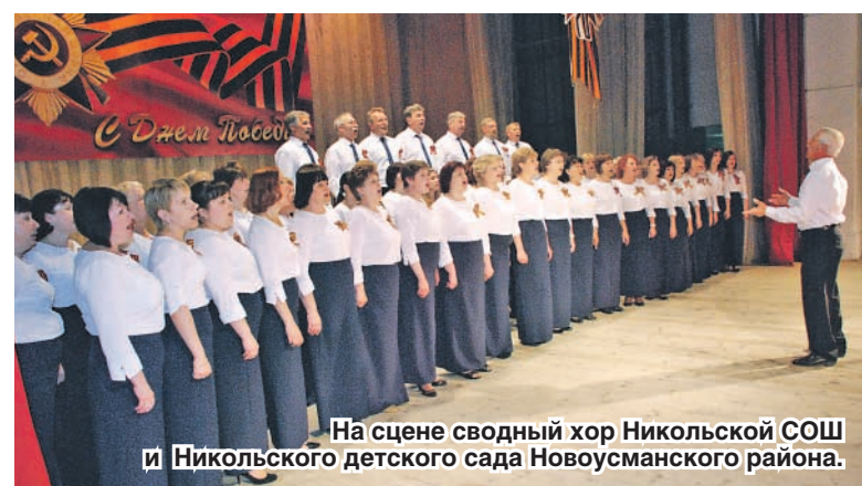
На сцене сводный хор Никольской СОШ и Никольского детского сада Новоусманского района.