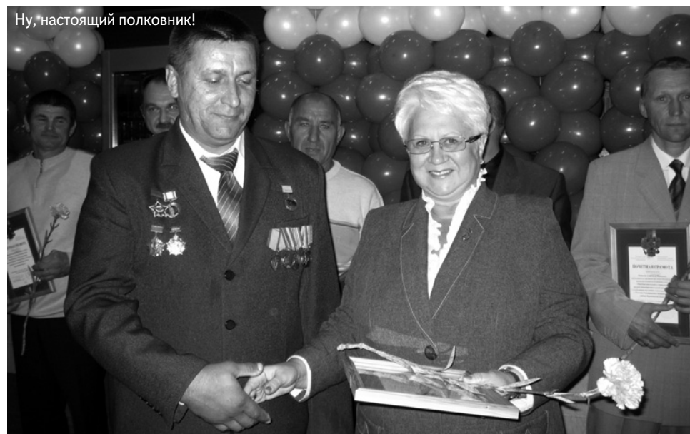
Ну, настоящий полковник!