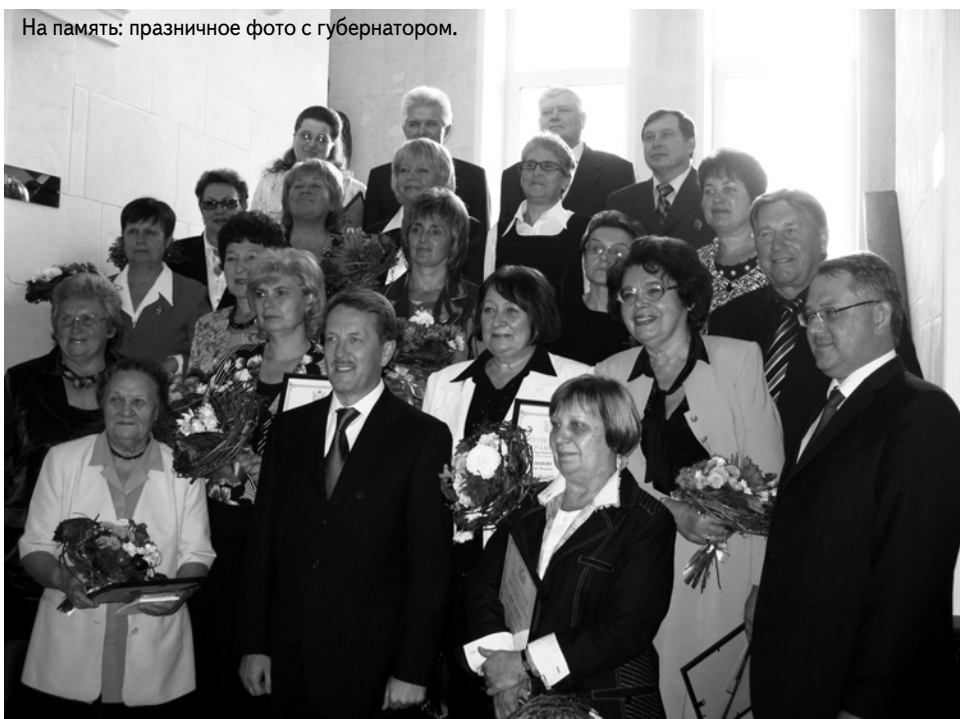
На память: праздничное фото с губернатором.

На вопрос сельского педагога губернатор Алексей Гордеев ответил... вопросами: «Что такое сельское поселение, деревня XXI века? Сможем ли мы сегодня удержать молодежь, привлечь молодые кадры на село, имея такое качество жилья? Я думаю, что нет...».