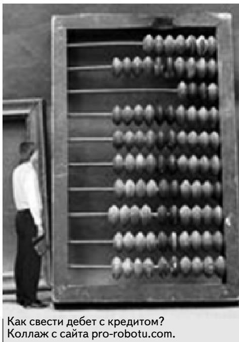
Как свести дебет с кредитом? Коллаж с сайта pro-robotu.com.